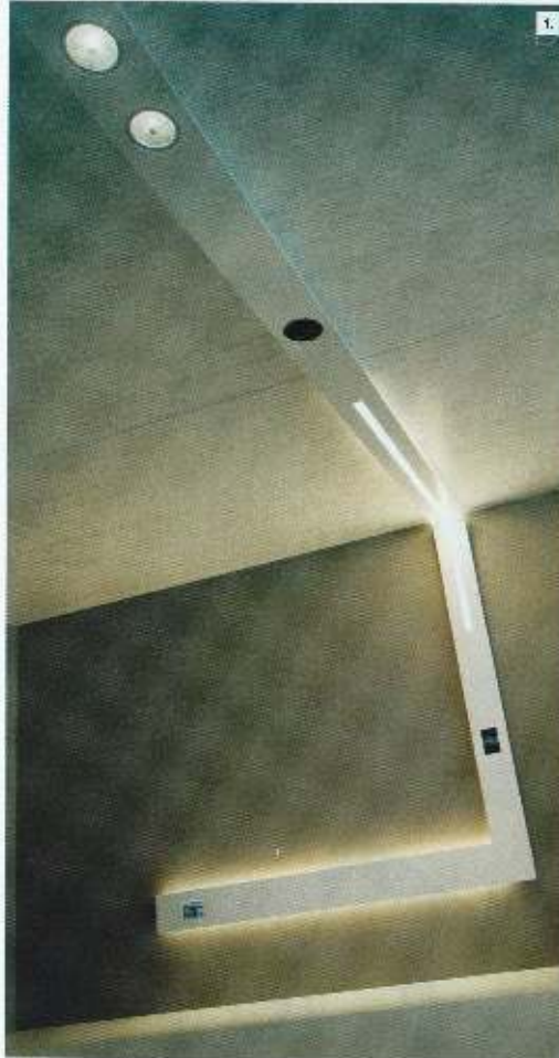
1. LUCIFERO'S DESIGN ALESSANDRO DURANTI SPONENT, SISTEMA DI ILLUMINAZIONE MODULARE A LUCE INDIRETTA, DIRETTA E A PROIEZIONE. MODULAR LIGHTING SYSTEM FOR AMBIENT, SPOT AND SPOT LIGHTING. www.luciferos.it